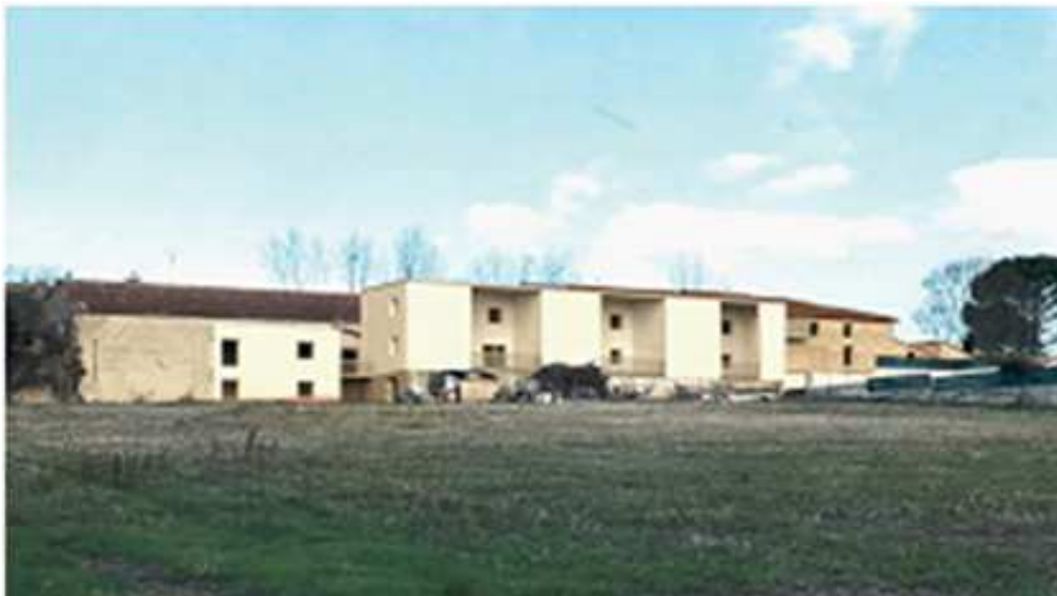
← Vue depuis le sud-ouest