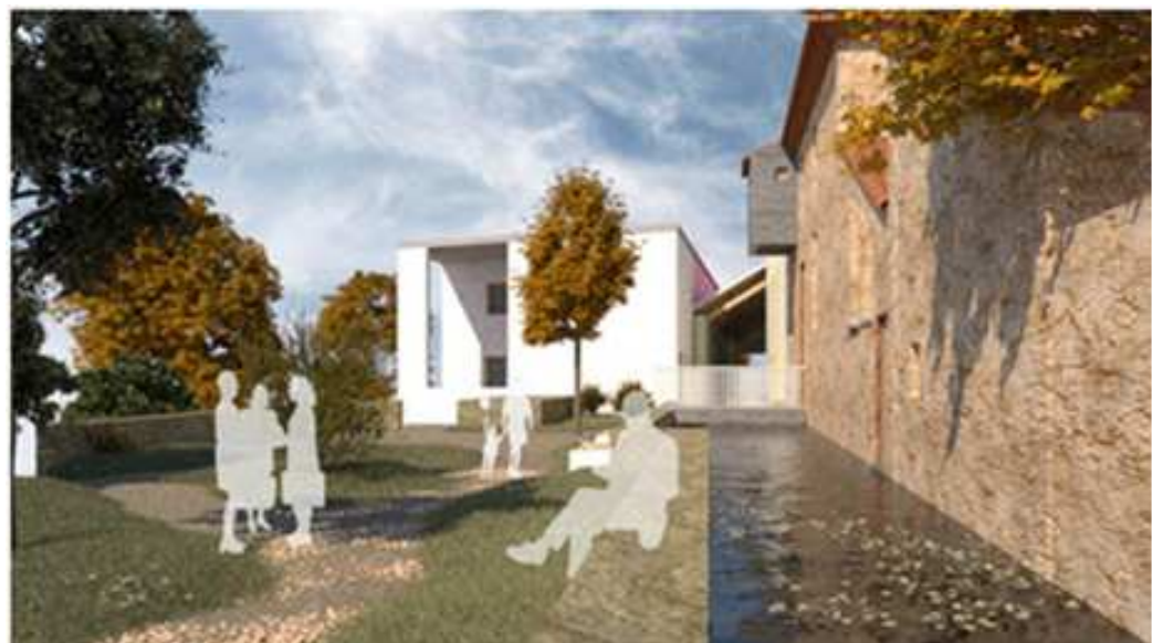
Vue depuis l'est →